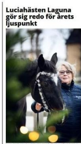
Luciahästen Laguna gör sig redo för årets ljuspunkt

Östern lockar en kylig morgon. Det är luciatåget här i Solna. Här ser du en av de många hästar som deltar i årets luciatåg.