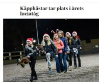
Käpphästar tar plats i årets luciatåg

Under året har vi även varit synliga i extern media. Inför årets luciatåg så hade vi både "Mitt i Solna" på besök som träffade luciahästen Laguna samt "SVD Junior" som intervjuade medlemmar i käpphästklubben.